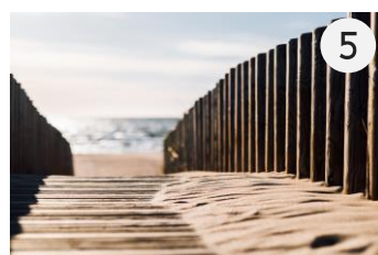
Ikoniskā dēļu taka