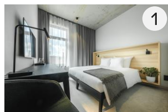
OTTO Hotel & Sun