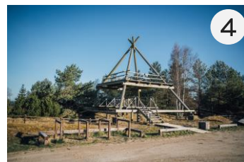
Pāvilostas skatu tornis