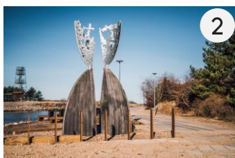
Pāvilostas atjaunotā promenāde