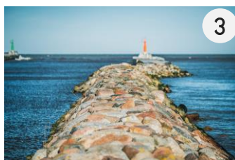
Pāvilostas Ziemeļu mols